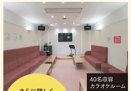
40名収容 カラオケルーム

さらに詳しく 知りたい方は スズケンWebサイト内 「コージユ高鷲」 コンテンツへ