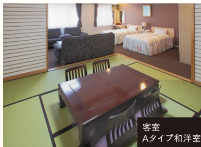
客室 Aタイプ和洋室

飛驒牧場で飼育された飛驒牛は 肉質・味も最高です。 極上の霜降り牛をぜひご賞味ください。